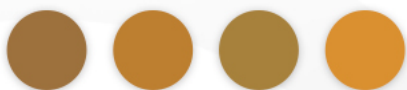
Shade A Shade B Shade C Shade D